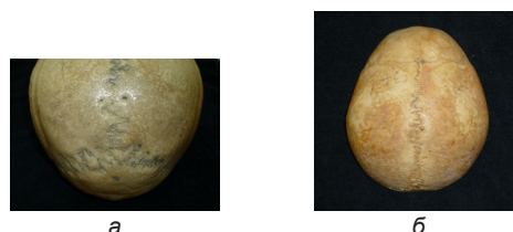
Рис. 3. Степень сложности швов наружной поверхности свода черепа: а – ламбдовидного (череп жен., 30 лет); б – сагиттального (череп жен., 27 лет)

На внутренней поверхности свода черепа различия в степени сложности медиальной (66,5±4,1%) и средней (52,3±4,2%) ( t=2,4 ; p<0,05 ), а также медиальной и латеральной (52,0±4,2%; t=2,2 ; p<0,05 ) частей ламбдовидного шва, первой (68,2±4,6%) и третьей (55,3±4,1%) частей сагиттального шва достигают уровня статистической значимости ( t=2,1 ; p<0,05 ). Остальные различия в степени сложности частей венечного, сагиттального и ламбдовидного швов не достигают уровня статистической значимости.