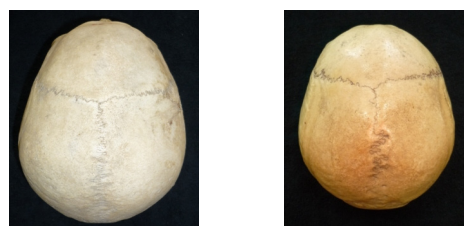
Рис. 2. Более выраженная степень сложности: а – средней части венечного шва (череп муж., 34 года); б – второй части сагиттального шва (череп жен., 30 лет)

В сагиттальном шве максимальная степень сложности наблюдается во второй части шва (227,3±9,7%) и достоверно больше, чем степень сложности в первой (154,4±5,9%; t=6,2 ; p<0,001 ) и третьей (123,1±7,1%; t=8,6 ; p<0,001 ) частях шва, что носит в высшей степени достоверный характер. Различия в степени сложности второй и четвертой (206,3±10,8%) частей сагиттального шва не достигают уровня статистической значимости ( t=0,5 ; p>0,05 ). Высшей степени достоверности достигают различия в степени сложности первой и четвертой частей шва ( t=3,9 ; p<0,001 ), первой и третьей частей ( t=3,7 ; p<0,001 ), третьей и четвертой ( t=6,4 ; p<0,001 ) частей сагиттального шва, т.е. сагиттальный шов обладает максимальными различиями степени сложности.