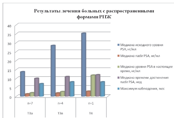
Рис. 2. Результаты лечения больных с локализованными формами РПЖ методом HIFU

У больных со стадией T3a, получающих параллельно гормональную терапию, значение PSA варьировало от 0,15 до 2,6 нг/мл и в среднем составило 1,3 нг/мл. Пациенты с местно-распространенным и метастатическим поражением получали неадьювантную и/или адьювантную гормональную терапию в режиме максимальной андрогенной блокады, вследствие чего уровень PSA перед HIFU был у них относительно низким. У больных из этой группы динамика значений PSA, несмотря на первоначально достоверное снижение после операции ( p < 0,05 ), была подвержена изменениям и имела тенденцию к постепенному нарастанию (табл. 5, рис. 2).