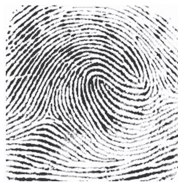
Рис. 2. Пальцевый узор "двойная петля"

различия между группами обнаруживаются в частоте самого простого узора "дуга" (рис. 3).